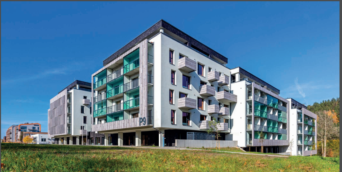
P9 Paplaujos apartments, Lituanie | Matériau/Materiale: ALUCOBOND® PLUS legno Antique Pine | Architecte/Architetto: 313 Architects | Transformateur/Trasformatore: LR group | Installateur/Installatore: Lakede | © Evaldas Lasys

ALUCOBOND® legno è completamente riciclabile mostrando un alto livello di sostenibilità del ciclo di vita del materiale.