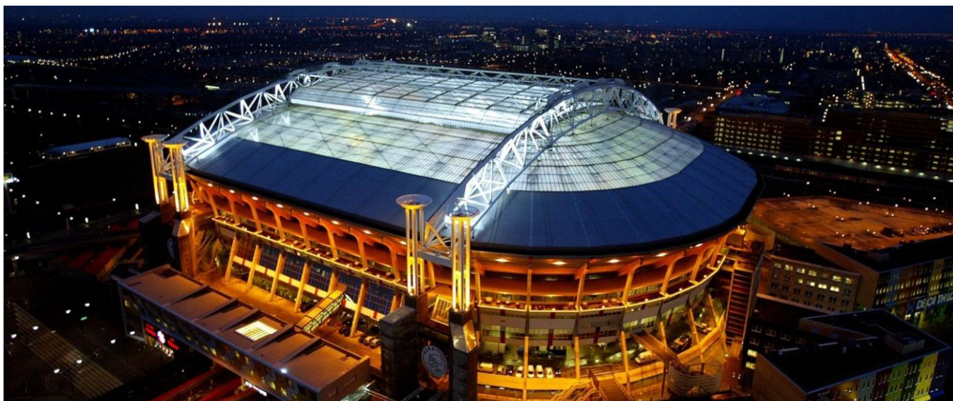
Johan Cruyff Arena, Pays-Bas, La plaque LEXAN™ THERMOCLEAR™ est utilisée depuis 1995, maintenant 28 ans !